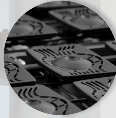
Komfortliegeflächen mit Tellersystem