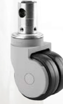
Rollen (75 mm)