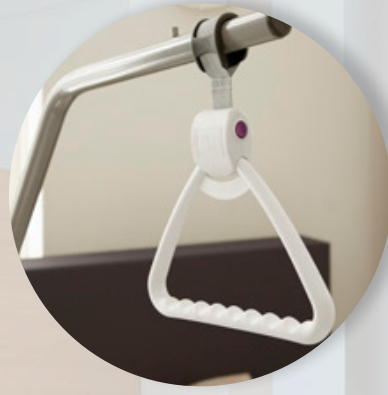
Automatisch/ Manuell einziehbarer Aufrichter