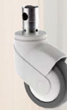
Rollen (100 mm)