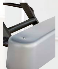
Rollen (75 mm) mit Rollenverkleidung (nur lieferbar für das Scintilla 2000)